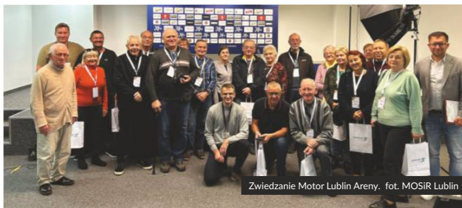
Zwiedzanie Motor Lublin Areny.