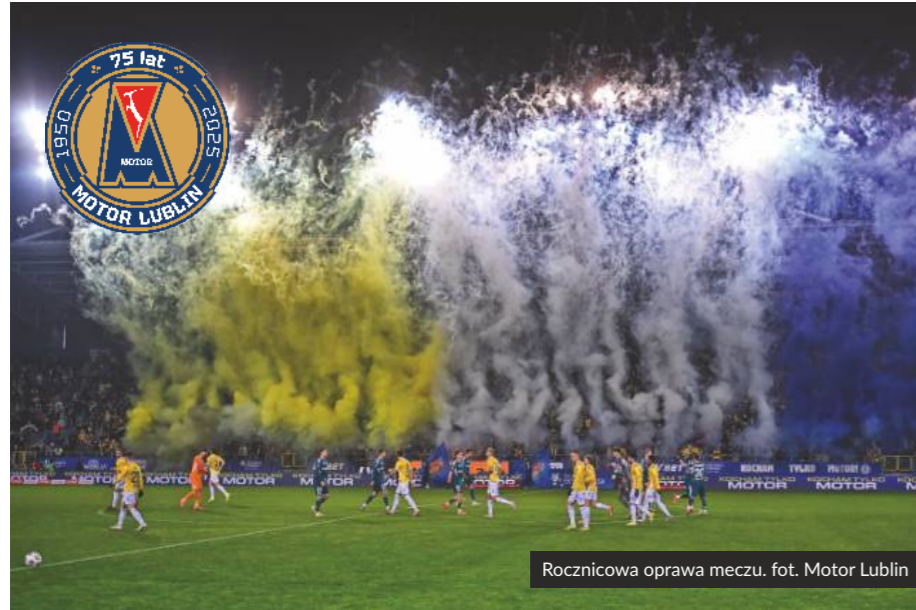
Rocznicowa oprawa meczu.

Może jestem już zbyt sentymentalny, ale w mijającym jubileuszowym roku 75-lecia Motoru zabrakło mi większego nawiązania do wcześniejszych lat świetności i przypomnienia tych piłkarzy, trenerów czy działaczy, których bez cienia przesady określić można jako klubowe legendy.