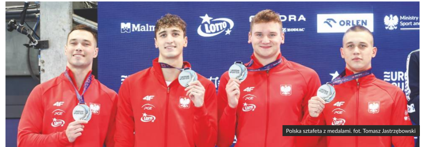
Polska sztafeta z medalami.

Bezpośrednio po mistrzostwach elity na obiekcie Aqua Lublin odbyły się zawody masters, czyli zawodników 25+. W rywalizacji organizowanej przez European Aquatics i Polski Związek Pływacki wzięło udział kilkuset zawodników z całego świata. (PS)