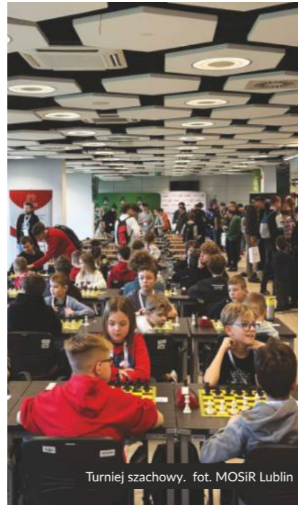
Turniej szachowy.

Jednym z celów Miejskiego Ośrodka Sportu i Rekreacji „Bystrzyca” w Lublinie jest łączenie